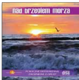
„Nad brzegiem morza”

Piękna muzyka instrumentalna z aranżacją gitary, a przede wszystkim z tłem odgłosów lasu. Słuchając jej można odnieść wrażenie obecności w pięknych lasach o letniej porze.